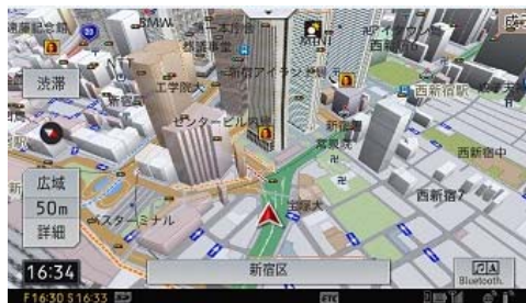
【スカイビュー表示】