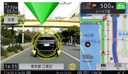
【画像認識技術を用いた「先進運転支援機能」】