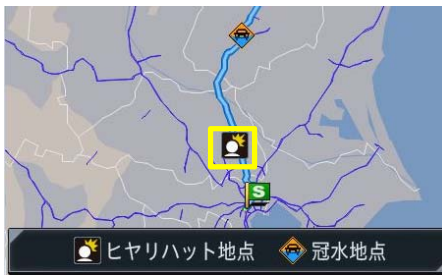
【ヒヤリハット地点を地図上に表示】