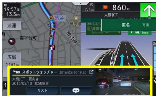
【ライブインフォ画面】