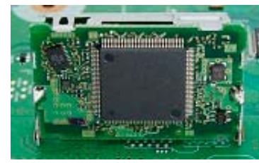
【位置精度を高める「レグルス」】