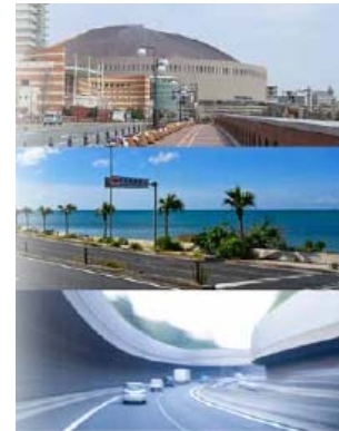
【ドライブ状況に合ったチャンネルを提案する「ライブレコメンド」】