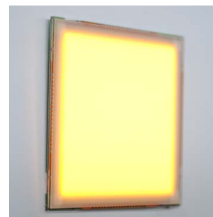
【ブルーライトレスモジュール】