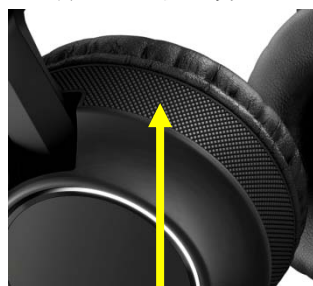
ローレット(凹凸)付き ラバーリング