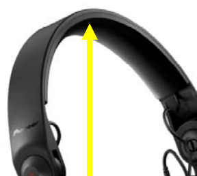
ポリアミド樹脂材を使った ヘッドバンド部

ヘッドバンド部に柔軟性のあるポリアミド樹脂材を、ハウジング外周にはグリップ性を高めるローレット(凹凸)付きラバーリングを採用しています。これにより、ハウジングをつかんでヘッドバンドを柔軟に曲げることが可能となり、首にかけながら即座にハウジングを耳に当てることができます。また、スライダーアームは前後それぞれに90度まで無段階に回転する構造なので、頭にかけた状態でも片耳でモニタリングできます。さらに、コード表面の細かいリブ(溝)で絡まりとタッチノイズを低減する、1.6mのストレートコードと1.0mのカールコード(最大伸長時約3m)を同梱しており、モニタリングスタイルに合わせて使い分けることができます。