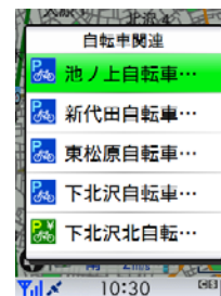
【周辺検索をしたリスト】

「周辺検索機能」により、最寄りの駐輪場を簡単に検索でき、同時に、名称、住所、連絡先、入出庫時間、休業日、収容台数などの詳細情報も表示できます。