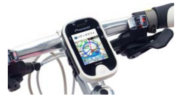
【自転車に取り付けた“ポタナビ”】