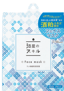
酒屋のスキルフェイスマスク 22ml/個包装5枚入り 1,485円(税込)

全配合成分：水、スクワラン、ポリソルベート60、ステアリン酸ソルビタン、BG、コメ発酵液、ヨーロッパキイチゴ種子油、シクロペンタシロキサン、トリエチルヘキサノイン、カルボマー、メチルパラベン、キサンタンガム、水酸化K、グリチルリチン酸2K、プロピルパラベン、トコフェロール、コメヌカ油、ヒアルロン酸Na