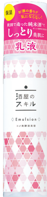
酒屋のスキル乳液 150ml 1,485円(税込)