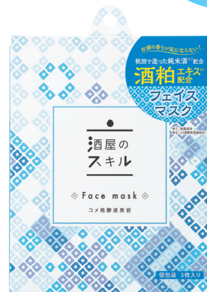
酒屋のスキルフェイスマスク 22ml/個包装5枚入り 1,485円(税込)