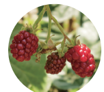
ヨーロッパキイチゴ種子油

全配合成分：水、スクワラン、ポリソルベート60、ステアリン酸ソルビタン、BG、コメ発酵液、ヨーロッパキイチゴ種子油、シクロペンタシロキサン、トリエチルヘキサノイン、カルボマー、メチルパラベン、キサンタンガム、水酸化K、グリチルリチン酸2K、プロピルパラベン、トコフェロール、コメヌカ油、ヒアルロン酸Na