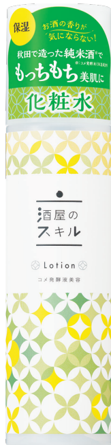
酒屋のスキル化粧水 180ml 1,485円(税込)