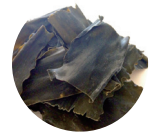
アルギン酸ナトリウム

*一般的なヒアルロン酸含有化粧水の配合量は1%溶液あたり0.1%としてその100倍以上(自社調べ)