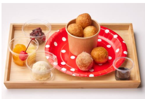
「丸亀うどんーなつ もっちり満喫セット」