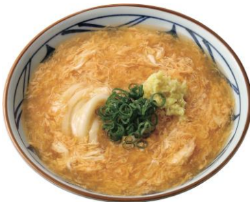
『玉子あんかけうどん』

おすすめの薬味は、おろししょうが。キリっとした辛さが加わり、体の中から温まっていただけます。