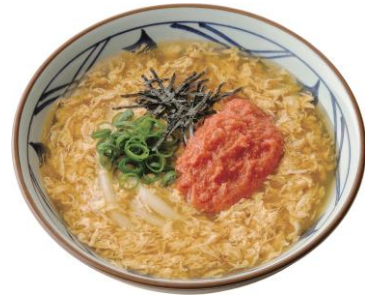
『明太玉子あんかけうどん』

シンプルだからこそ、だしの風味や玉子あんかけ本来の甘みと旨みを感じることができる一杯。薬味で味わいの変化を楽しむのもおすすめ。