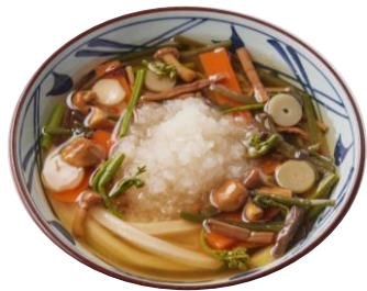
『山菜おろし冷かけうどん』(冷)

だして煮込んだなめこ、ぜんまいなどの彩り豊かな山菜の食感、特製の冷たいかけだしに浸った大根おろしのさっぱりした味わいが、のどごしの良いうどんにぴったりな一杯です。