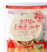
フラワートルティーヤ 10 枚入