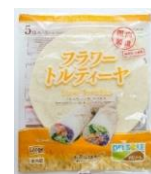
フラワートルティーヤ 5 枚入 Large