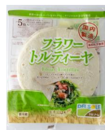
フラワートルティーヤ 5 枚入