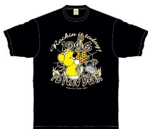
T シャツ/Rockin it today! 4,400 円(税込)

“コワイ(コワくてカワイイ)”をコンセプトとしたウェアや雑貨が所狭しと並ぶ店内は、まさに hide のイタズラな原色のイメージが詰まったオモチャ箱。年に数回のキャンペーン期間中はウィークリーNew アイテムを発売するほか、スタンプカードキャンペーンではノベルティをプレゼントします。