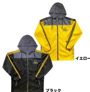
ラインパーカー(ブラック・イエロー) 18,700 円(税込)