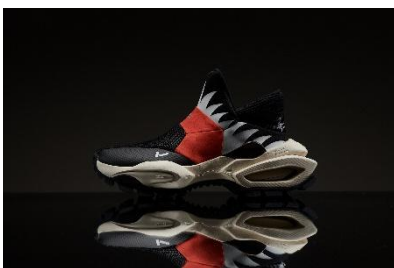
朱鷺(トキ)モデル/Toki Model 79,200 円(税込)

(※8月中旬より発売予定)。プロジェクトを通じて希少生物への理解とその保護を啓蒙していきます。