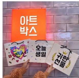
ギフトボックス 550~600円(税込)