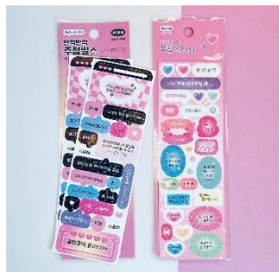
シール 2枚入り 450円(税込)