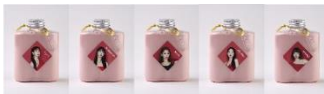
MILK MILK MILK!