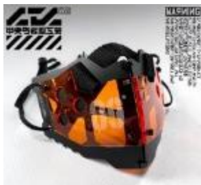
装甲マスクユニット mk9 clear orange 6,000円(税込)

世界初のリアルショップがオープン！中央町戦術工芸は、アクリル樹脂を用いて、工業/近未来的デザインのアクセサリを開発しているデザインチーム。独自の加工技術で「誰も見たことのないスタイル」を提案し、斬新なスタイルはSNSを中心に内外で話題となっています。ラフォーレ原宿 B0.5F の自主編集売場「愛と狂気のマーケット」出店を経て、この度ついに常設店舗に。ハンドメイド生産もこなすスタッフが常駐し、簡単なメンテナンスも店舗で行います。ラフォーレ限定商品や試作モデル等を取り扱い、アーティストやイラストレーターとの限定コラボも実施いたします。