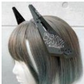
カチューシャ式装甲バインダーユニット 9,900円(税込)