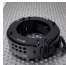
装甲リストバンドユニット type06-solid 8,800円(税込)