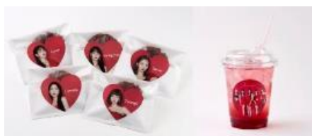
ovgo B.A.K.E.R Meiji St.