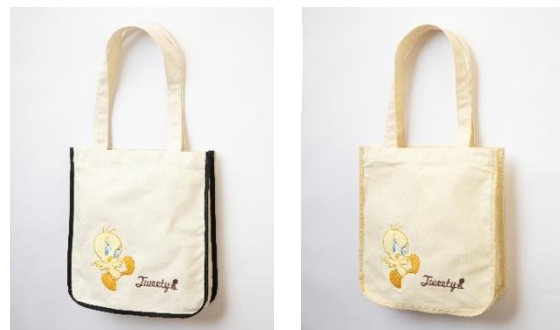
パイピングスクエアトートバッグ 各 5,500円