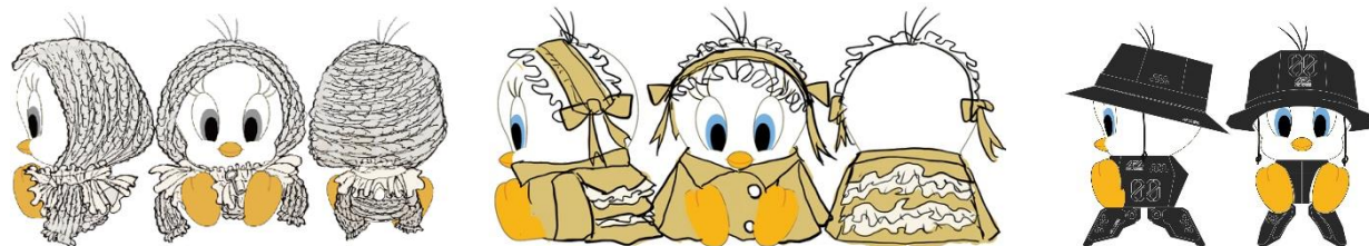
<スタチューデザインイメージ>

10名のクリエイターによって独創的なデザインに変身したトゥイーティのスタチューをお楽しみいただけます。