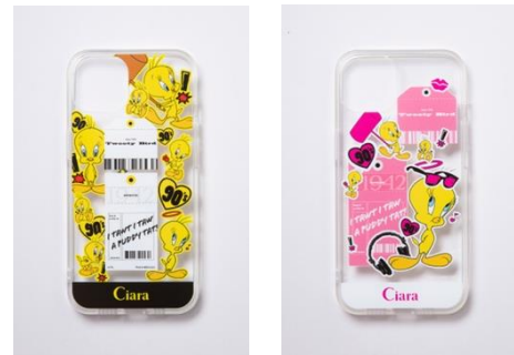
スマホケース 各 3,300円