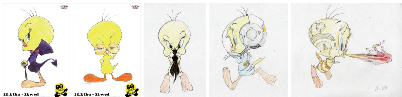
<イラスト原画一例>

※オリジナルトゥイーティーをパラパラ漫画風にした限定ノベルティもご用意 (お買上条件がございます)。