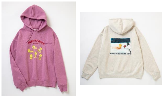
ビッグパーカー 各 5,940円