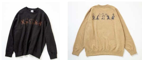
プルオーバー 各 7,590円