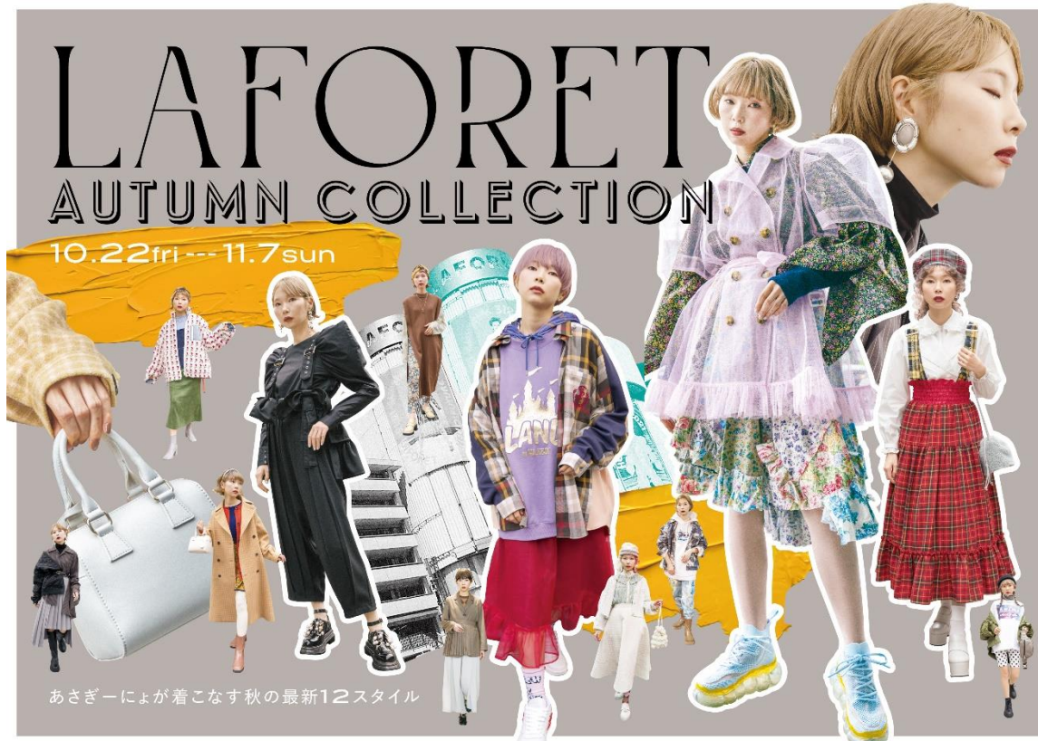
あさぎーによが着こなす秋の最新12スタイル

館内 32 ショップ、人気ユーチューバー／アーティスト「あさぎーによ」が着る ラフォーレ原宿の秋の最新 12 スタイル