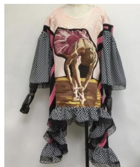
att production バレリーナワンピース 50,402 円(税込)