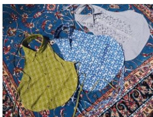
SAUCE SAUCE ORIGINAL Half shirt 11,000 円(税込)