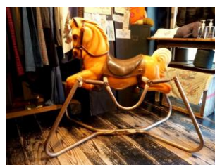
side car charlie vintage rocking horse 44,000 円(税込)