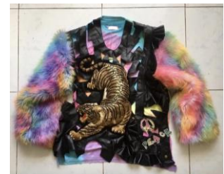
att production トラトップス 59,752 円(税込)