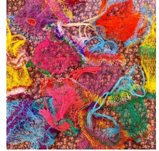
LECABAS BAG 2,750 円(税込)