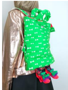
ルンルンリュックサック 35,200円(税込)