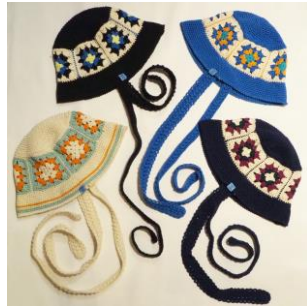
Antage x SAUCE Granny crochet HAT 10,560 円(税込)