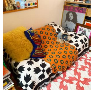
crochet rug 7,700 円(税込)