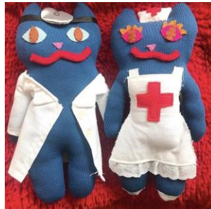
Dr. にゃーとニャース 9,350円(税込)