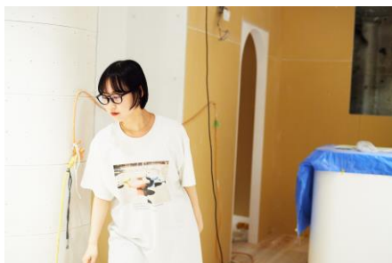
kensuke hosoya X circle in circle 上代 ¥6,050(税込)