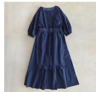
ワンピース 6,490円(税込)