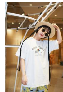
FRUIT circle ¥6,050(税込)