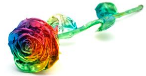
LIBERTY ROSE 35,000円(税込)