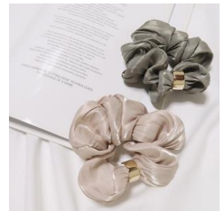
スモーキーカラーシュシュ 990円(税込)