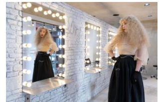
NYLON TULLE BLOUSE 27,500 円(税込)