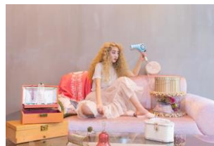
DOUBLE RUFFLE BLOUSE 20,350 円(税込)