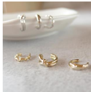
メタル set イヤカフ 1,430円(税込)