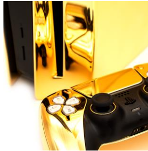
Play station 5 GOLD CUSTOM 250,000円(税込)