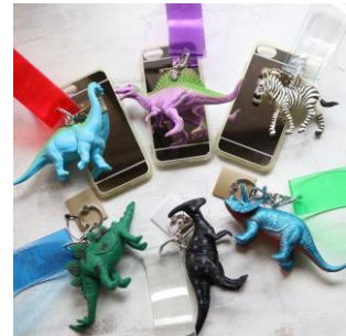
スマホチャーム 5,500円(税込)