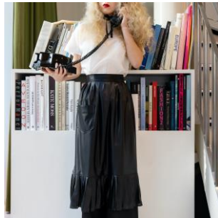
STRIPE APRON 9,350 円(税込) CALENDER APRON 9,900 円(税込)