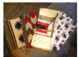
vintage sheets ラグマット 22,000 円(税込)