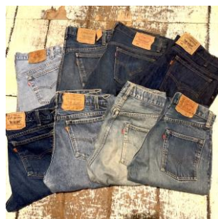
STEP A HEAD ヴィンテージリーバイス 11,000 円(税込)