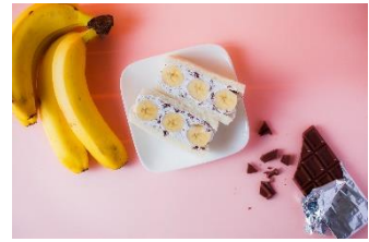
旬の4種が贅沢に！ FruitsBox サンド 500円(税込)