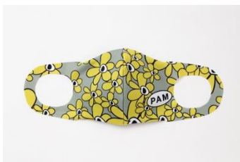
P.A.M. P.A.M. (FLOWER) 1,500円(税込)