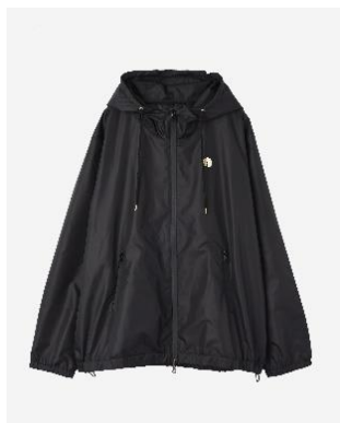
Hooded Jacket 16,500円(税込)