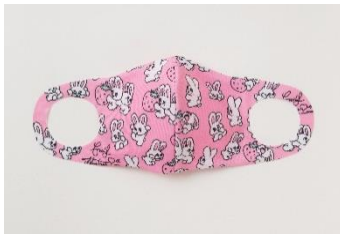
foxy illustrations foxy illustrations (BUNNY) 1,500円(税込)