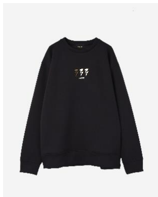
Anniversary Logo Sweat 15,400円(税込)