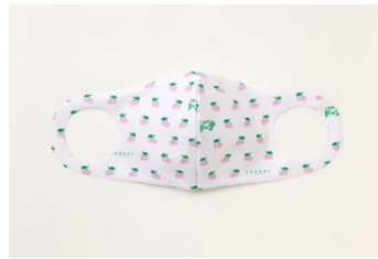
LABRAT LABRAT (CHERRY) 1,500円(税込)