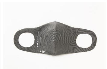
F/CE. F/CE. (GRAY) 1,300円(税込)