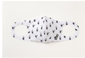
千代の富士 千代の富士 (WHITE) 1,500円(税込)