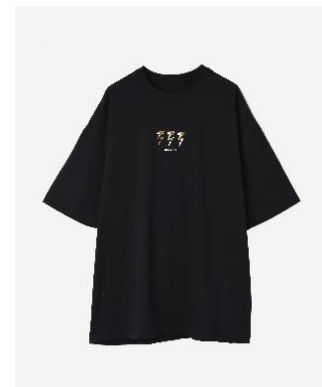
Anniversary Logo T-shirts 9,900円(税込)