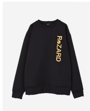
Vertical Logo Sweat 15,400円(税込)