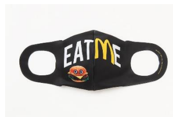
MILKBOY MILKBOY (BURGER) 1,500円(税込)