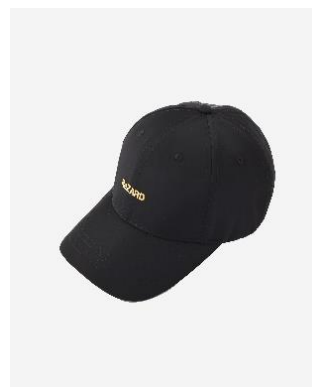
Logo Nylon Cap 8,250円(税込)