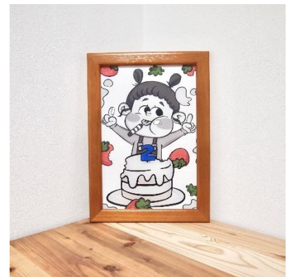
ZERO ZERO HERO 33,000 円 (税込)