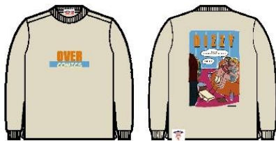
PIZZA STAFF Heavy oz LS Tee 6,600 円 (税込)