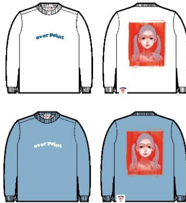
over paint Heavy oz LS Tee 6,600 円 (税込)