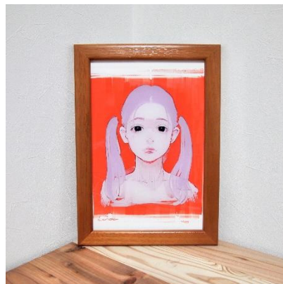
over paint/古塔つみや 55,000 円 (税込)