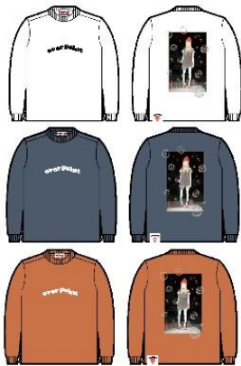
FILM Heavy oz LS Tee 6,600 円 (税込)