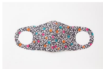
jouetie jouetie (LEOPARD) 1,500円(税込)