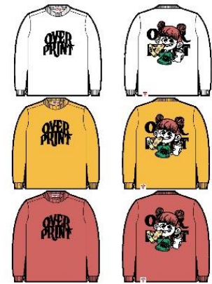
DIZZY Heavy oz LS Tee 6,600 円 (税込)