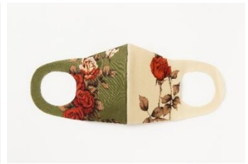
AMERI AMERI (FLOWER) 1,500円(税込)