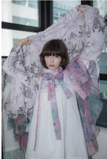
【rurumu:】sacredness garden BL 49,500円(税込) 【papier】cotton mini op 15,180円(税込) 【oum】グラフィックジャージ 58,300円(税込) 【oum】グラフィックハイネックタートル 25,300円(税込)

こだわりを持った個性豊かなモノづくりが人気を集める3ブランド「rurumu:」「oum(Ω)」「papier」が今回のPOP UP SHOPのために、合同でMIXコーディネートのおルックを制作。東京を拠点に活動する3組の、ここでしか見れない独自の世界観を是非お楽しみください。