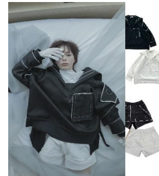
20SF04 セーラー 51,700円(税込)