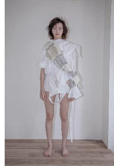
【papier】bra top 9,350円(税込) 【papier】high west shorts 9,680円(税込) 【oum】セーラー 51,700円(税込) 【rurumu:】pleats collar BL 41,800円(税込) 【rurumu:】fringe snood 27,500円(税込)