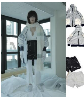
20SF03 切替ハイネックビッグパーカー-IVORY 57,200円(税込)