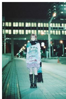
【縷縷夢兎】hand knit OP 79,750 円(税込) 【rurumu:】long muffer 23,100 円(税込)