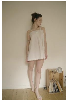
cotton mini op 15,180 円(税込)