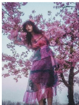
【rurumu:】sacredness garden BL 49,500 円(税込) 【rurumu:】sacredness garden SK 49,500 円(税込)