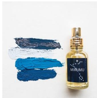
FINCA MIRUMU ホロスコープ Ver. 2,800円(税込)