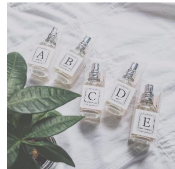
FINCA オードトワレ イニシャル Ver.(全26種) 各2,800円(税込)