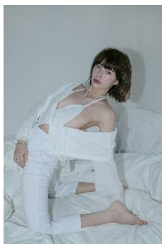
bra top 9,350 円(税込) cotton blouse 17,600 円(税込) rib pants 19,910 円(税込)