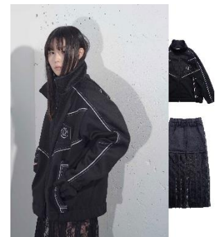
20SF01 ジャージトップ BLACK 42,900円(税込)