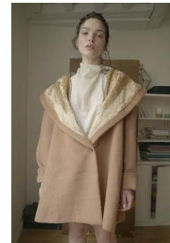
back open rib 19,250 円(税込)