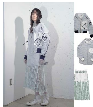
20SF06 サークルポケットジャケット ICEBLUE 59,400円(税込)