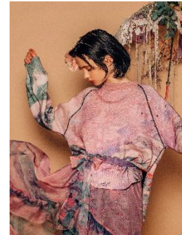
【rurumu:】sacredness garden knit PO 44,000 円(税込)