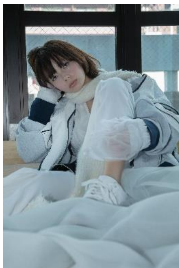
【oum】切替ハイネックビッグパーカー 57,200円(税込) 【oum】シューズ 31,900円(税込) 【papier】back open rib 19,250円(税込) 【papier】rib pants 19,910円(税込) 【rurumu:】long muffler 23,100円(税込)