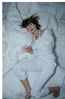
bra top 9,350 円(税込) cotton blouse 17,600 円(税込) rib pants 19,910 円(税込)