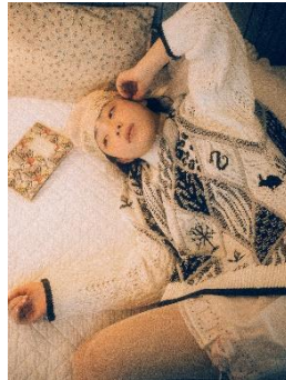
【rurumu:】mix pattern knit PO 41,800 円(税込)