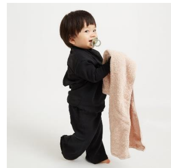
back open rib 8,800 円(税込) rib pants 9,900 円(税込)