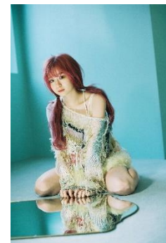
【縷縷夢兎】hand knit PO 72,600 円(税込)