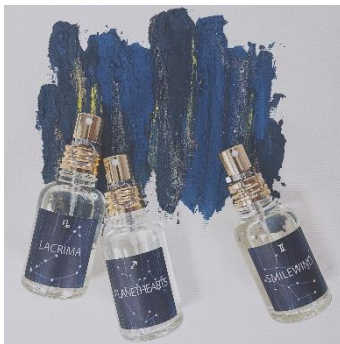
FINCA オードトワレ ホロスコープ Ver.(全12種) 各2,800円(税込)