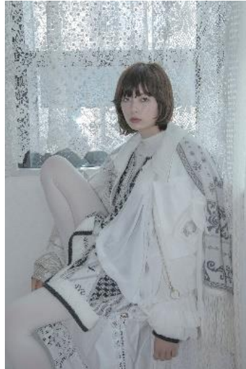
【rurumu:】mix pattern knit PO 41,800円(税込) 【rurumu:】gradation knit stole 34,650円(税込) 【oum】サークルポケットジャケット 59,400円(税込) 【papier】gathered jacket 20,680円(税込)