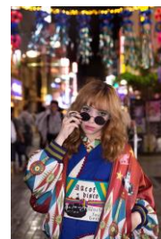
スター社コラボ リバーシブルブルゾン (BOY 柄ボルドー×ネイビー) ¥64,900(税込)