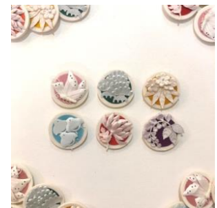
“花紋”ブローチ ¥5,830(税込)

2020.1.13(Mon) - 1.22(Wed) 1F entrance space