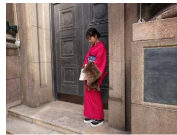
きもの色無地チェリーレッド ¥63,800(税込)