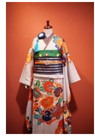
OTSUKAGOFUKUTEN × WAKON FURISODE4 ¥165,000(税込)