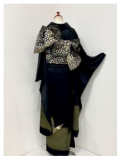
正絹振袖 黒地蝶文 ¥132,000(税込)