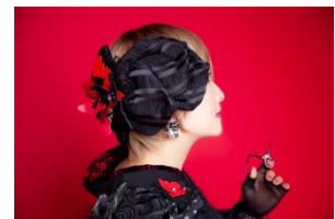
Fleurir ～花びらのヘッドドレス ¥30,800(税込)