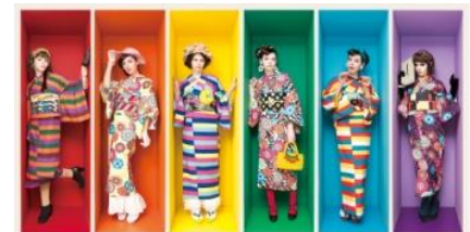
重宗玉緒 オリジナル着物 ¥60,500(税込) オリジナル帯 ¥46,200~¥68,200(税込)