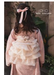
ふわふわ帯【作り帯】 ¥33,000(税込)