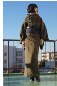
ハイカロリイオトメ 着物「ベース」 ¥42,900(税込) フードネックウォーマー ¥12,100(税込)