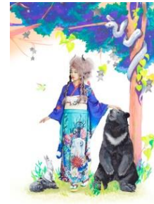
C.H.O.K.O x Rui 二尺振袖「THE WORLD」 ¥176,000(税込) 西陣織袋帯「minor arcana」 ¥143,000(税込)