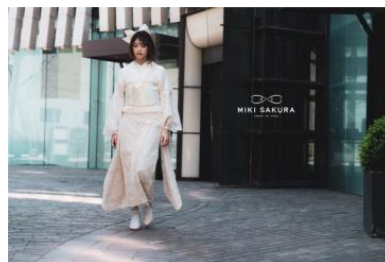
オフホワイトレース振袖 ¥107,800(税込) コルセット風帯 ¥29,700(税込)