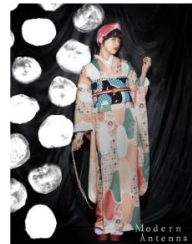
【MOD】坂道ドット 黒 ¥59,400(税込)