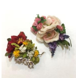
ヘッドドレス ¥19,800(税込)~