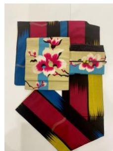
アンティーク正絹お召し ネオン ¥19,800(税込)