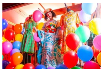
鳩柄ポリエステル振袖 水色 ¥128,150(税込)