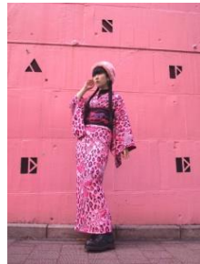
iroca 着物「ヒョウモン」 ¥63,800(税込) 半幅帯「Red lips」 ¥26,400(税込)