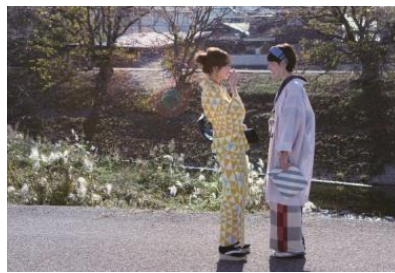
コットンきもの 伊勢木綿レッド ¥42,900(税込)