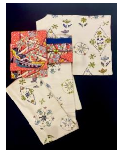
アンティーク正絹小紋 モザイク ¥46,200(税込)