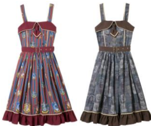
ハリー・ポッター & ファンタスティック・ビースト プリントジャンパースカート 価格: 各 41,904 円(税込)