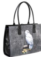
ハリー・ポッター 3WAY バッグ 価格: 19,440 円(税込)