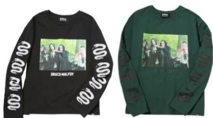
ハリー・ポッター ロング Tシャツ 価格: 各 8,532 円(税込)