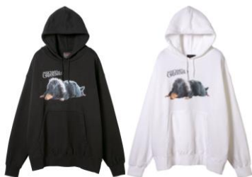
ファンタスティック・ビースト パーカー 価格:各 10,584 円(税込)