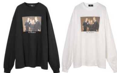
ハリー・ポッター ロング T シャツ 価格:各 6,480 円(税込)