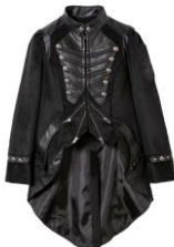
ハリー・ポッター ジャケット 価格: 35,424 円(税込)