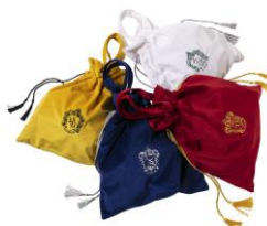
ハリー・ポッター ペロアバッグ 価格: 各 8,100 円(税込)