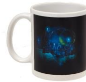
ハリー・ポッター マグカップ 価格: 1,998 円(税込)