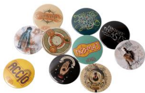
ファンタスティック・ビースト 缶バッジ 価格:各 270~324 円(税込)