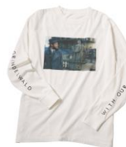
ファンタスティック・ビースト ロングTシャツ 価格:3,780 円(税込)