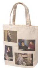
ハリー・ポッター トートバッグ 価格: 5,724 円(税込)