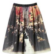
ハリー・ポッター スカート 価格:6,469 円(税込)