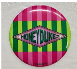
＜先行＞缶ミラー ハリー・ポッター ハニーデュークス 価格:864円(税込)