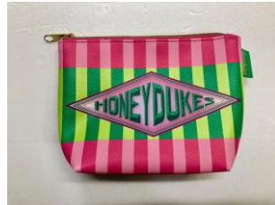
＜先行＞合皮ポーチ ハリー・ポッター ハニーデュークス 価格:1,296円(税込)