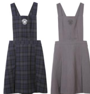
ハリー・ポッター ジャンパースカート 価格:各 25,920 円(税込)