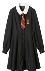
ハリー・ポッター グリフィンドールのワンピース 価格: 12,960 円(税込)