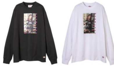
ハリー・ポッター ロング T シャツ 価格:各 7,020 円(税込)