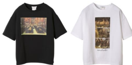
ハリー・ポッター Tシャツ 価格: 各 4,860 円(税込)