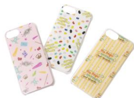
ハリー・ポッター & ファンタスティック・ビースト スマホケース 価格:各 3,132 円(税込)