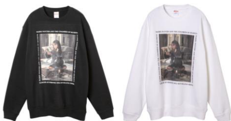
ハリー・ポッター スウェット 価格: 各 7,020 円(税込)