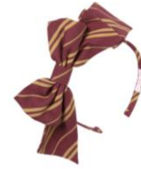
ハリー・ポッター ワンピースとカチューシャのセット 価格: 37,584 円(税込)