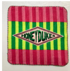
＜先行＞ハンドタオル ハリー・ポッター ハニーデュークス 価格:648円