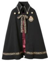
ハリー・ポッター ミドル丈マント 価格: 35,424 円(税込)