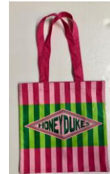
＜先行＞カラートート ハリー・ポッター ハニーデュークス 価格:1,080円(税込)