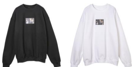
ハリー・ポッター スウェット 価格: 各 6,372 円(税込)