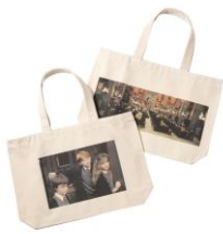
ハリー・ポッター トートバッグ 価格:各 5,292 円(税込)