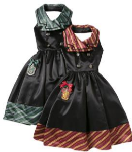
ハリー・ポッター ワンピース 価格: 各 32,400 円(税込)