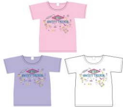
＜限定＞Tシャツ ハリー・ポッター ハニーデュークス 価格:3,132円(税込)