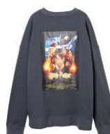
ハリー・ポッター スウェット 価格:6,480 円(税込)