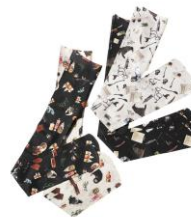
ハリー・ポッター & ファンタスティック・ビースト タイツ 価格:各 4,320 円(税込)