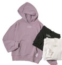
ハリー・ポッター パーカー 価格:各 7,452 円(税込)