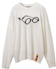
ハリー・ポッター ニット 価格:15,120 円(税込)