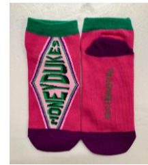
＜先行＞キャラクターズ ハリー・ポッター ハニーデュークス 価格:410円(税込)