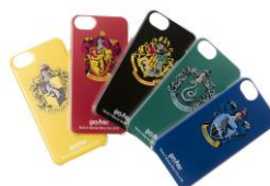
ハリー・ポッター スマホケース 価格: 各 3,218 円(税込)