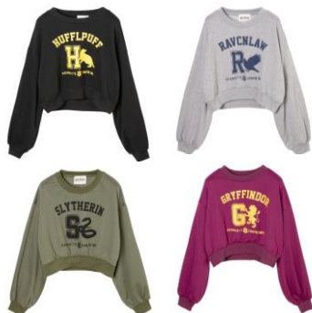
ハリー・ポッター スウェット 価格:各 4,309 円(税込)