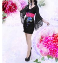
商品名: Kimono fringe mini dress 価格: 12,960 円(税込)