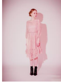
商品名: Off-Shoulder Lace Dress / Pink 価格: 21,578 円 (税込)