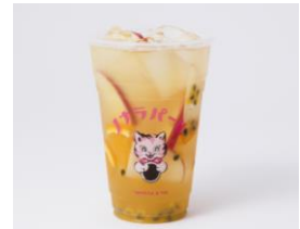
商品名: フルーツティー 価格: 572 円(税込) ※M サイズ