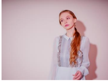
商品名: Pastel Chiffon Dress / Green 価格: 36,698 円 (税込)