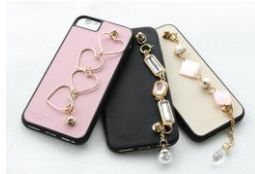
商品名: SARTORIA 価格: 4,298 円(税込)