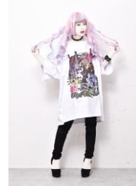
商品名: コラージュ転写プリントビッグ TEE 価格: 8,640 円(税込)