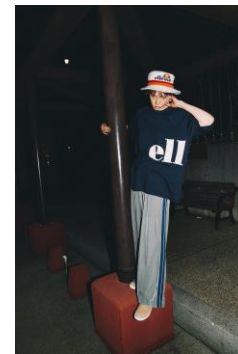
商品名: Heritage Bucket Hat 価格: 5,292 円 (税込) 商品名: Round Logo Tee 価格: 4,212 円 (税込) 商品名: Lined Velour Flare Pant 価格: 12,960 円 (税込)