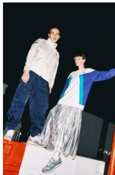
[left]商品名: Color Block Wind Jacket 価格: 17,280 円 (税込) [right]商品名: Color Block Sweat Crew 価格: 11,880 円 (税込) [both]商品名: Heritage 84 Marathon Trainer 価格: 14,040 円 (税込)