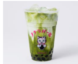
商品名: 抹茶牛乳タピオカ 価格: 561 円(税込) ※M サイズ