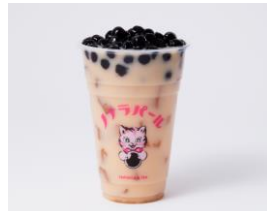
商品名: ブラックミルクティー タピオカトッピング 価格: 507 円(税込) ※M サイズ