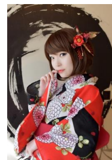
織り鶴髪飾り -椿- 8,640円(税込)