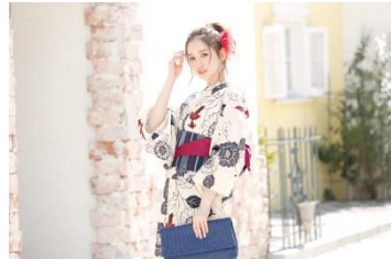
浴衣3点セット 21,980円(税込)