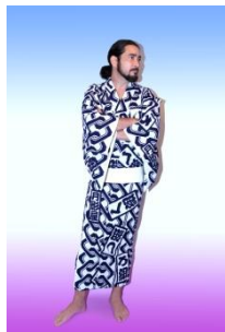
よ組とろ組とし組とく組の喧嘩の浴衣 55,529円(税込)