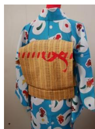
麻袋袋帯(バスケット) 45,360円(税込)