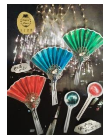
扇子かんざし/りんご飴かんざし 11,772円/5,400円(税込)