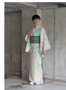
ポリエステル夏着物 流水 Light 64,800 円(税込) 名古屋帯 43,200 円(税込)