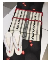
浴衣セオ(ハートinハート) 45,360円(税込)