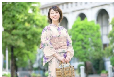
浴衣3点セット 20,800円(税込)