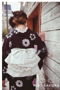
Parfum 着物/ふわふわ帯(作り帯) 59,400 円/32,400 円(いずれも税込)