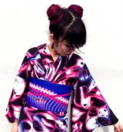
iroca 浴衣「bones」/半幅帯「snake bones」 浴衣:39,960 円/半幅帯:25,920 円(いずれも税込)