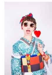
注染浴衣「トランブレース」/リバーシブル西陣織 半幅帯「ブロックチェック」 浴衣 46,440 円/帯 45,360 円(いずれも税込)