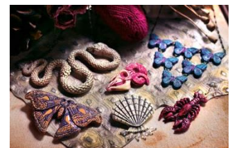
conoco 生き物のアクセサリ 3,780 円～10,260 円(いずれも税込)