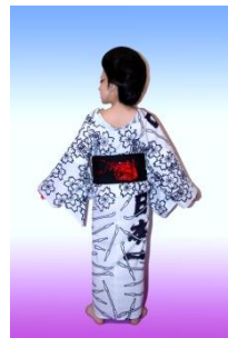
伊勢海老の半巾帯 158,209円(税込)