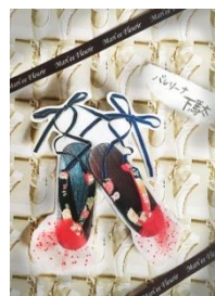
バレリーナ下駄 6,372円(税込)