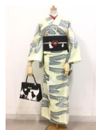
浴衣セオα(あしあと・・・) 45,360円(税込)