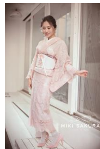
レース着物/コルセット風兵児帯 49,680 円/29,160 円(いずれも税込)