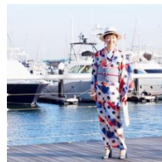
セオ・アルファブレタ浴衣「マリンロープ」トリコロール 43,200 円(税込)