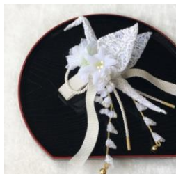
総レースの織り鶴髪飾り 「Bouquet」-White- 10,800円(税込)