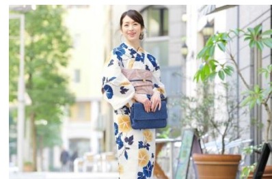
浴衣3点セット 20,800円(税込)