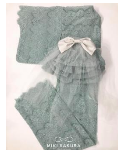
レース着物/ふわふわ帯(作り帯) 49,680 円/32,400 円(いずれも税込)