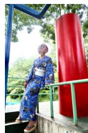
C.H.O.K.O ユカタ「Flickering Polka」/兵児オビ ユカタ:56,160 円/兵児オビ 28,080 円(いずれも税込)