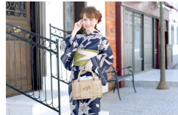
浴衣3点セット 21,980円(税込)