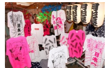
月影☆ていーしゃつ 8,617~15,817円(税込)