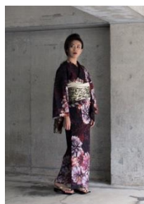
ポリエステル夏着物 ダリア 62,640 円(税込) 兵児帯ラメドット 14,040 円(税込)