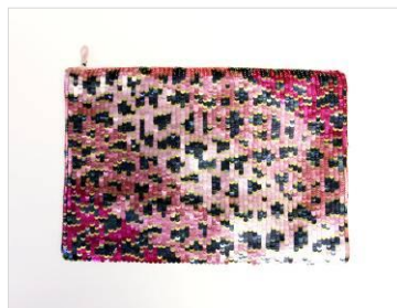
商品名: Pink Gradation (ラフォーレ原宿限定) 価格: 9,000 円