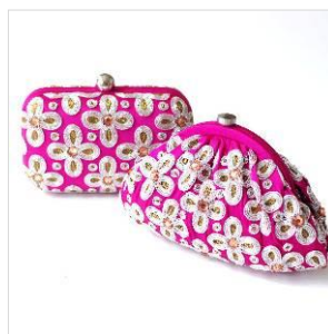
商品名: Embroidered Floral 価格: (左)25,000 円 / (右)24,000 円