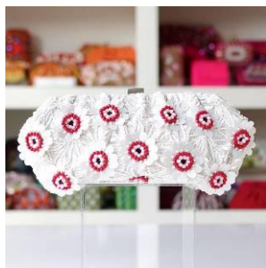
商品名: Red Beaded Flower 価格: 23,000 円