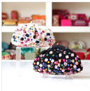
商品名: Glamorous Bijoux 価格: 各 24,000 円