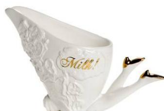
ミルクジャグ 8,190 円 (Undergrowth Designn)