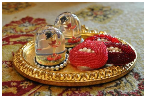
(左)スノードーム 各 3,675 円 / (右)バレッタ 各 14,700 円 (ともに goblin x Sedmikrasky)