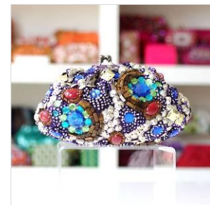
商品名: Glamorous Night 価格: 23,000 円