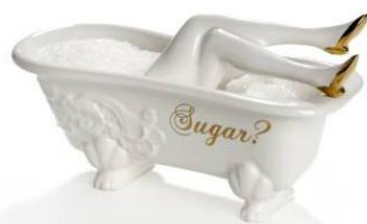
シュガーバス 8,190 円 (Undergrowth Designn)