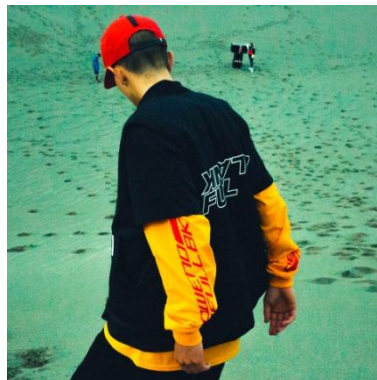
LOWEND LS TEE 7,560円(税込)