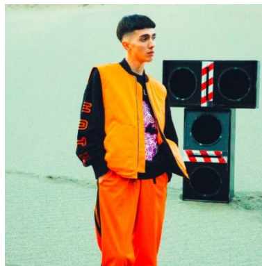
PRINT VEST 21,600円(税込)