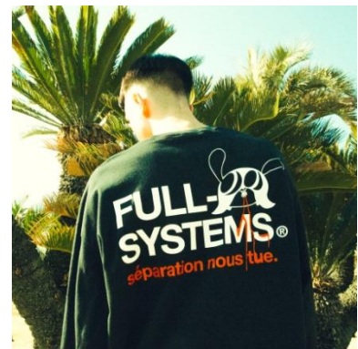
SKOLOCT × FULL-BK LS TEE 7,560円(税込)