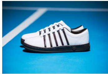
CLASSIC88 10,584 円(税込)