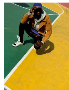
Shinya yamaguchi/Chain Parka 34,560 円(税込)