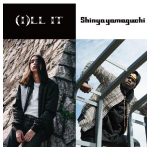
(LEFT)ILL IT/THE ATTITUDE BOMBER JACKET 31,320 円(税込)