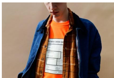
Delivery Long Sleeve Tee 7,344 円(税込)