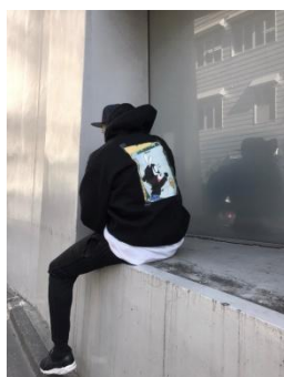
Art gang money hoodie 28,000 円(税込)