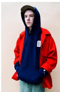
Speedy Hooded Parka 9,900 円(税込)