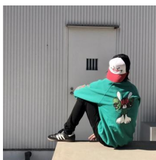
get money crewneck 19,000 円(税込)