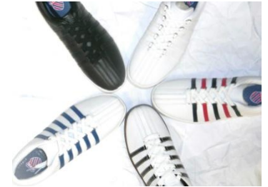
CLASSIC88 10,584 円(税込)