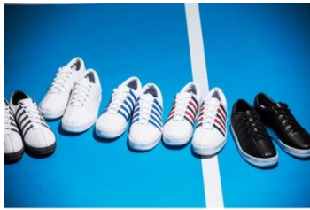
CLASSIC88 10,584 円(税込)