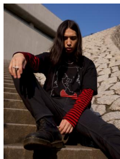
ILL IT/JOEY SHADOW TEE 8,640 円(税込)