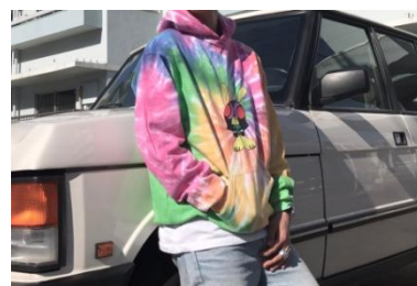
crazy sko hoodie 19,000 円(税込)