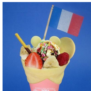
Princess Crepe「プリンセスクレープ」 980 円(税込) (期間中、CAFE CREPE にて販売)