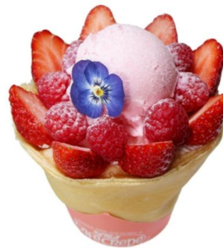
CAFE CREPE「フラワーストロベリー」 9 ユーロ (期間中、Princess Crepe にて販売)