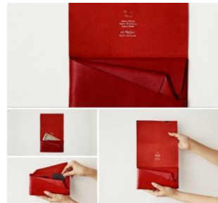
商品名: 所作ロングウォレット赤 価格: 22,000 円(税込)