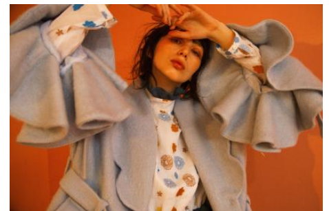
商品名：Camellia Coat 価格：73,980 円（税込）