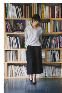
商品名：ニットスリーブ TOP ／キミとワタシで PNT 価格：28,080 円（税込）／30,240 円（税込）