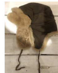
商品名: フライトキャップ 価格: 7,020 円(税込)