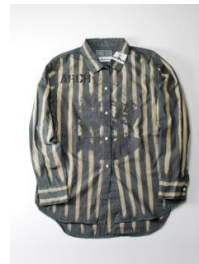
商品名: anarchy shirts marx 価格: 34,560 円(税込)