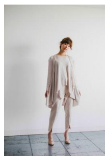
商品名：AnthuriumTOP 価格：28,080 円（税込）