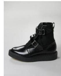
商品名: bondageboots bk 価格: 72,360 円(税込)