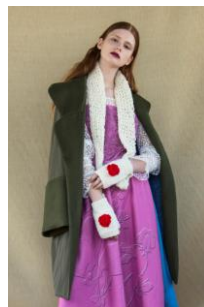
商品名：vail / hooded pull over 価格：30,240 円（税込）