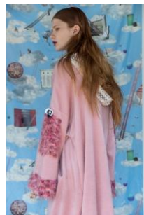
商品名：FIORE / big one piece 価格：62,640 円（税込）