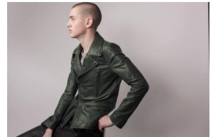
商品名: ライダース(カラービスポーク) 価格: 119,880 円(税込)