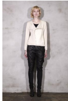
商品名: huei ノーカラー・コンビネーション 価格: 29,160 円(税込)

→ No, No, Yes! ← LEATHER TAILOR 原宿 POP-UP