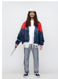
商品名: ジャンパー 価格: 34,560 円(税込)