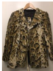
商品名: カットオフファーコート 価格: 16,200 円(税込)