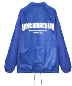
商品名: EXCLUSIVE FORUM COACHES JACKET 価格: 13,824 円(税込)