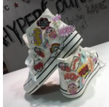
商品名: BADGED SNEAKER 価格: 14,904 円(税込)