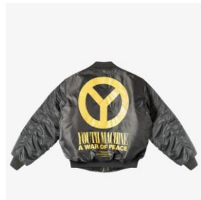
商品名: WARRIORS FLIGHT JACKET 価格: 17,064 円(税込)