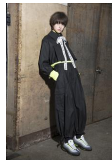
商品名: ショートタックジャケット 価格: 27,000 円(税込) 商品名: カーゴパンツ 価格: 22,680 円(税込) 商品名: ネオンリブニット 価格: 14,040 円(税込)