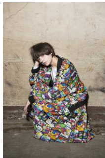
商品名: ハイパーマンブルゾン 価格: 45,360 円(税込) 商品名: ハイパーマンスカート 価格: 19,440 円(税込) 商品名: ログシシュウ Tシャツ 価格: 6,372 円(税込)