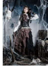
商品名: ダメージガーゼロングスカート 価格: 21,384 円(税込) 商品名: ハードコルセット 価格: 11,664 円(税込)