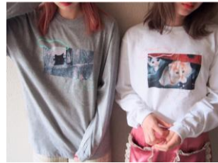
商品名:ねこロンtee 価格:6,372円(税込)