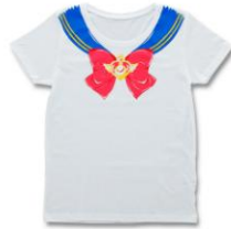
商品名:美少女戦士セーラームーン なりきりセーラーTシャツ 価格:3,240円(税込)