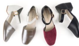
商品名:セパレートミドルヒールパンプス 価格:5,900円(税込)