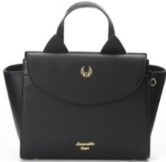
商品名:【Samantha Vega コラボ】 美少女戦士セーラームーン ルナハンドバッグ 価格:28,080円(税込)