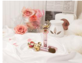
商品名:ミラクルロマンスチークブラシ(2種) 価格:3,456円(税込)

※紹介している商品はセーラームーンストア オリジナル商品ではございません。 ※商品は随時入れ替わるため品切れの場合がございます。