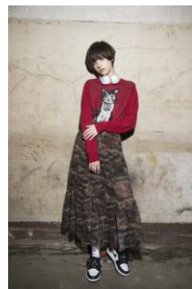
商品名: タマジャガードニット 価格: 17,280 円(税込) 商品名: カモフラプリントスカート 価格: 19,440 円(税込)