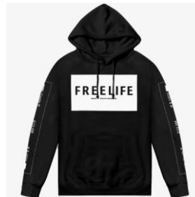
商品名: FREELIFE CLASSIC HOODIE 価格: 13,824 円(税込)