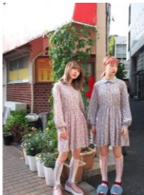
商品名:おはなボロワンピース 価格:9,180円(税込)