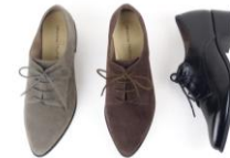
商品名:レースアップシューズ 価格:6,900円(税込)