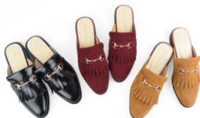
商品名:ビットモチーフスリッパ 価格:5,900円(税込)