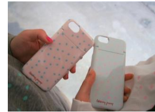
商品名:ドットiPhone ケース 価格:4,212円(税込)