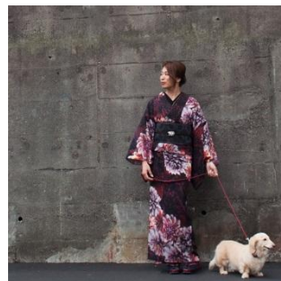
楊柳着物ダリア 38,000 円(税別)