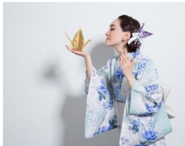
織り鶴カチューシャ 5,000円(税抜)