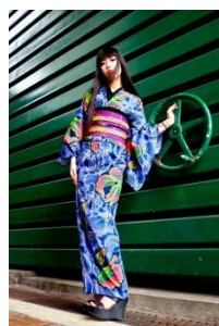
iroca 浴衣「BETTA water mosh」 37,000 円(税抜)