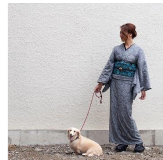
綿麻着物 Nythology 60,000 円(税別)