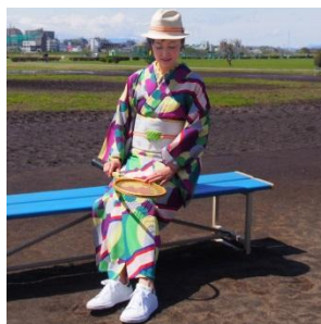
モダン着物小物 梅屋 セオ・アルファブレタ浴衣 【サークルボーダー】ディープ 40,000円(税抜)