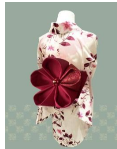
つまみ細工帯 30,000円(税抜)～