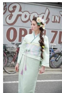
マカロン着物(袷) 55,000円(税抜) 甘い香りに誘われて半幅帯 20,000円(税抜)