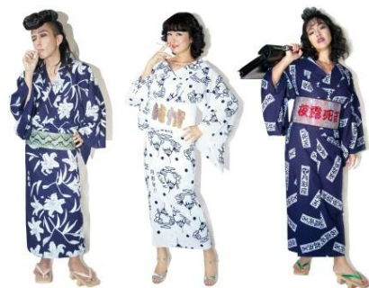
火娑舞乱嘩の浴衣 51,416 円(税抜) 蛇皮の角帯 55,000 円(税抜) プリン・ア・ラ・モードの浴衣 51,416 円(税抜) 純情の帯 90,000 円(税抜)