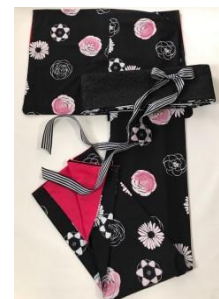
Parfum 着物(袷) 55,000円(税抜)