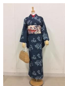
セオα 浴衣(AB...Z) 40,000円(税抜)