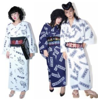
まりことアキラの浴衣 51,416 円(税抜) 走死走愛の帯 60,000 円(税抜) 露死苦浴衣・紺 51,416 円(税抜) 鱒嫉妬婆流道の帯 113,824 円(税抜)