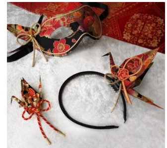
織り鶴マスク 8,000円(税抜) 織り鶴カチューシャ 3,500～5,000円(税抜) 織り鶴ブローチ 2,500円(税抜)