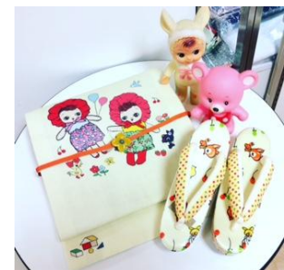
麻京袋帯(文化人形) 42,000円(税抜) 草履 24,800円(税抜)