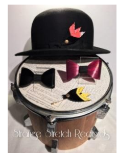
strange stretch records 「vinyl bow tie」7,800～8,800 円(税抜) 「feather hat pin」3,400 円(税抜)