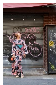
C.H.O.K.O x 摩登アンテナ 浴衣・夏キモノ「45 Flow」 56,000 円(税抜)