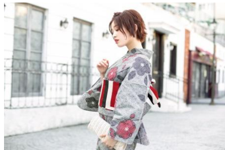
浴衣セット 14,630 円(税抜)