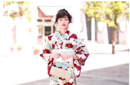
浴衣セット 20,186 円(税抜)