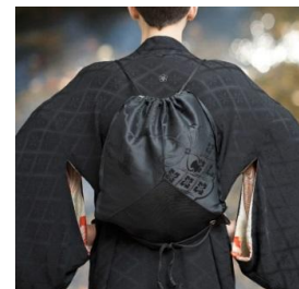
Napsack-Kuro 15,000 円(税抜)