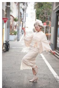
レース着物 38,000円(税抜)