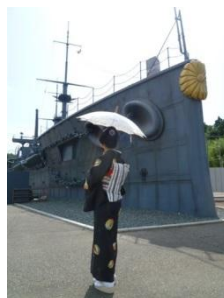
セオα 浴衣(紙風船) 38,000円(税抜)