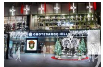
Design by ベルベッタ・デザイン ※画像はイメージです。 ©Disney

ウォルト・ディズニーが周りの人々を深い愛情で包んでいたように、表参道ヒルズも訪れるすべての人々に「Love～愛に包まれたクリスマス」を感じていただけるような演出をします。メインエントランスには、ハートを背景にしたミッキーとミニーのフォトスポットが登場。また、吹抜け大階段には、スワロフスキーやミラーボール、色とりどりの LED で彩られた約 10m のツリーが登場。華やかな空間で、ディズニーのプリンセス達とともにクリスマスの舞踏会が行われるような環境演出も施します。