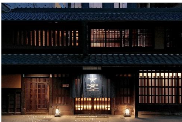
カンデオホテルズ京都烏丸六角 外観

京都市登録有形文化財である旧伴家(ばんけ)住宅をそのまま活かしつつ、現代の生活に合わせてリデザインしたレセプション棟と最先端のスペックを備えた宿泊棟で構成されています。