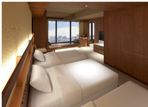
客室イメージ「トリプル」