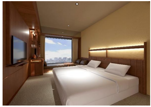
客室イメージ「ツイン」