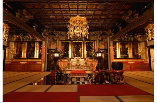
七宝山大福院 三津寺 本堂

三津寺は西暦 744 年に聖武天皇の命により行基菩薩が応神天皇の菩提を弔うために十一面観音菩薩像を彫って祀ったことを開創とする真言宗寺院です。本尊は、十一面観世音菩薩で、その他にも薬師如来や弘法大師、愛染明王など、平安から江戸時代の仏像を数多くお祀りしています。現在の本堂は西暦 1808 年の建立となっており、大阪市内では珍しい第二次世界大戦の戦果を免れた江戸期の木造建築です。そのため、堂内の天井に描かれた 100 を超える色とりどりの花卉(かき)図や、漆や金箔・色絵で彩られた柱や彫刻など、豪華絢爛な江戸美術の荘厳が残っており、その歴史を現在の大阪に引き継いでいます。