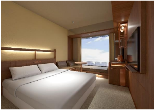
客室イメージ「キング」

「カンデオホテルズ大阪心斎橋」は、クラフトマンシップを感じる洗練された空間の客室を、キング、ツイン、トリプル、ユニバーサルトリプルの4種類のバリエーションをご用意しています。全部屋の特徴として、浴室と洗い場が独立したセパレートタイプとなっており、スカイSPAでももちろん、自室でも快適なバスタイムをお楽しみいただけます。なんば駅、心斎橋駅共に5分圏内とアクセスが良く、目的に合わせて選択できるバラエティ豊かな客室をご用意することで、ビジネス、レジャーなど様々なシーンでのご利用が可能となっております。