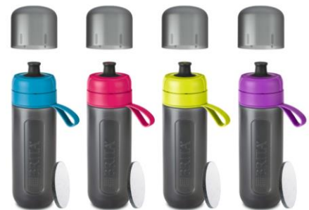
fill&go Active(フィルアンドゴー アクティブ)