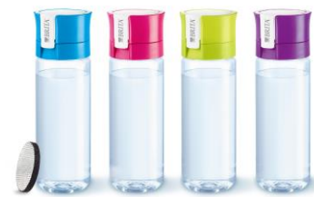
fill&go(フィルアンドゴー)