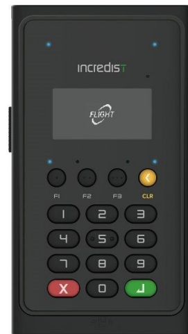
■ Incredist Premium III 端末

Incredist Premium III は、2015 年初代 Incredist Premium から受け継いだコンパクトでありながら高性能なデザインを維持しつつ、最新の国際セキュリティ基準 PCI PTS（Payment Card Industry PIN Transaction Security）（*1）v6 に対応し、日本市場向けに最適化しています。その特徴として、マイナンバーカード読取への対応、及び日本の電子マネーで用いられるタッチ面周囲の多色 LED や決済時のサウンド機能等を備えています。当社はこれらの機能を活かし、引き続き国内の大手小売店様を中心に販売を展開していく予定です。