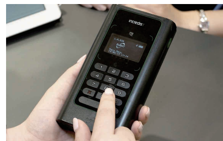
銀行カードではお客様に暗証番号を入力してもらう