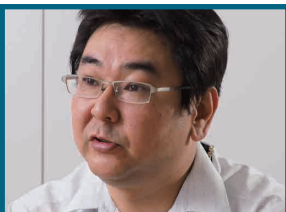
ソフトバンクモバイル株式会社 情報システム本部 課長

iPad版GINIEの全店舗への展開に向けて導入を進めています。新システムは従来のPC版GINIEの全機能をきちんと置き換えることができました。パソコンを置いたカウンターから開放されたことで、店舗クルーのマインドも変わりました。いかにお客様を待たせないようにするか、いかに効率よく業務を進めるかという意識が生まれています。機器がシンプルになったことで機器故障への対応も素早くなり、保守用機器の在庫スペースを減らす効果も得られました。