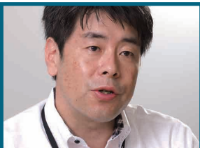
ソフトバンクモバイル株式会社 営業推進本部 統括部長

新システム導入の大きな目的は「接客の時間を短くしたかった」ことです。パソコンを使う従来システムでは、カウンターの数でどうしても接客のスピードが制限されていましたが、新システムではiPadとIncredistの2つさえあれば業務を進められる。カウンターを離れて、並んでいるお客様の元に向くことも可能ですし、家族全員で来訪されたお客様に対して、テーブルを囲んで説明することもできます。iPadの画面で説明することで、料金プランなど短い時間で理解していただけるようになります。新システム導入の後は、顧客満足度も目に見えて向上しました。