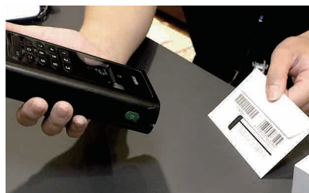
製品のバーコード読取

店舗でのiPad活用を見て、iPadへの興味が湧いた顧客も出てきた。新システムは、iPad業務活用のショーケースとしての役割も果たしているのだ。