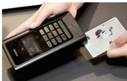
クレジットカード、銀行カード、Tポイントカード等の読取