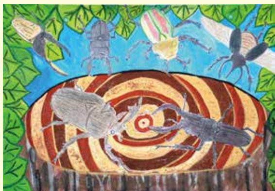
かなくほ あさひ 金久保 旭冴 ぼくの大すきなせかいの カブト虫とクワガタ虫