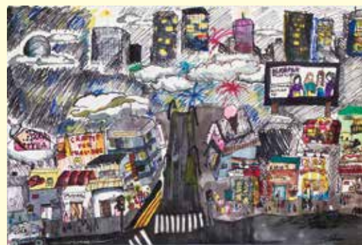
ELIANA TURNER Night of Japan