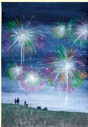
いながき りあ 稲垣 琳愛 利根川大花火大会