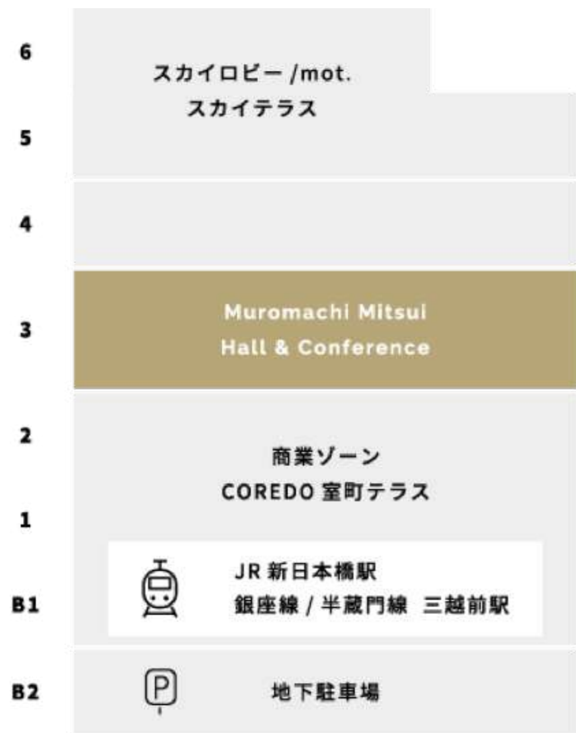
シンポジウムホール