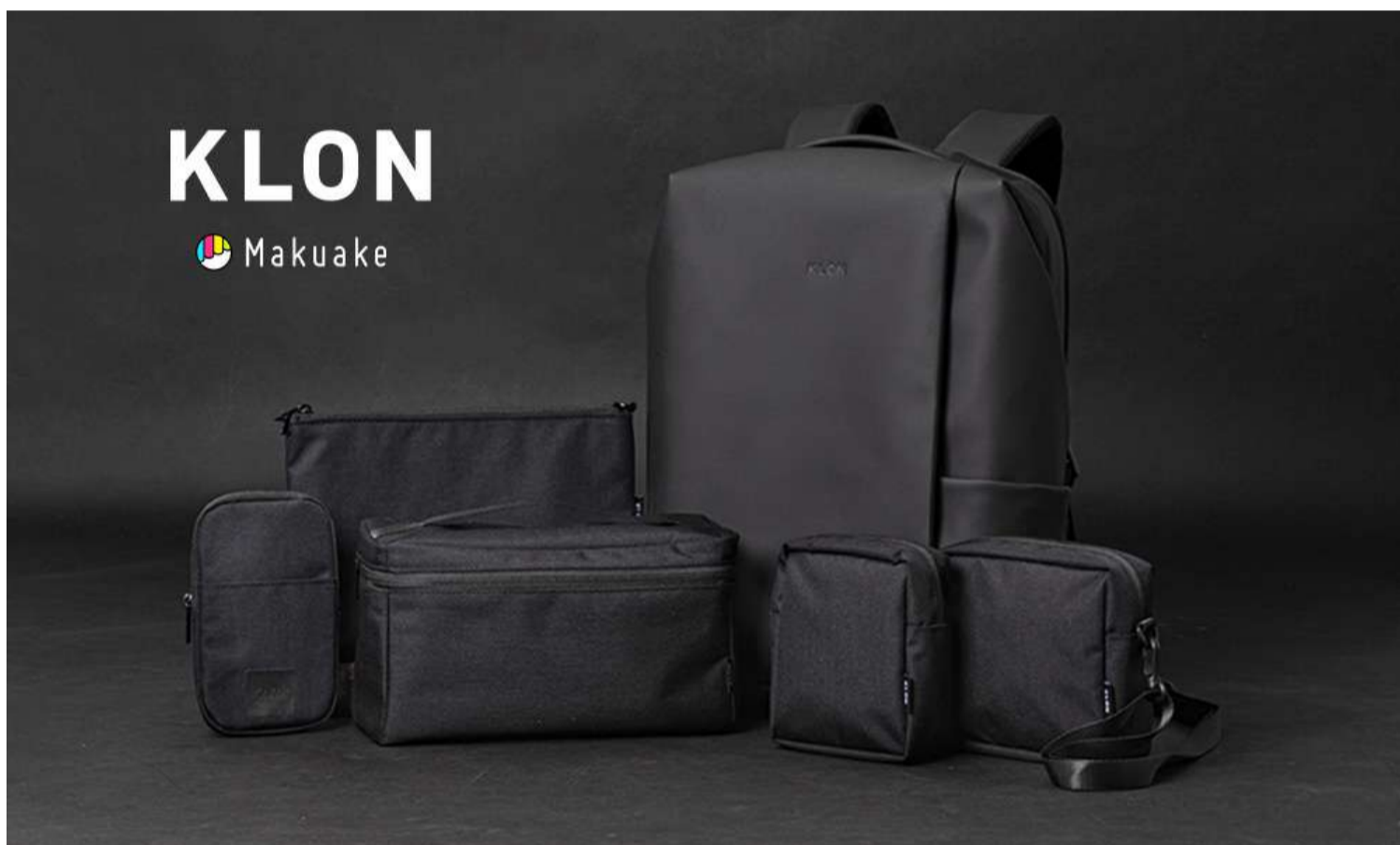
KLON FULL FUNCTION BACK PACK

前回のプロジェクトでは960万円のご支援を受け、大ヒットを記録した初代モデルをさらに進化させた待望の第2弾です。