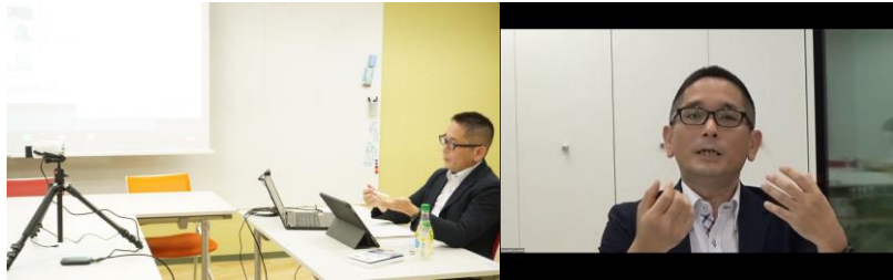
オンラインセミナーの様子

書籍発売に際して、6月10日に女性限定キャリアスクール「SHElikes」で行われたオンラインセミナーでは、20代～30代を中心に約140名の方にご参加いただき、「投資に対する難しいというイメージが払拭され、身近なものなんだと感ずることができました。」「投資はお金のためだけではなく、自分の人生を豊かにするための手段だということが分かり、投資に対するイメージがかなり変わりました!」「お金の投資だけでなく、自己投資という言葉でスキルアップについてもご説明いただいたところがとても役立ちました! お金と時間、能力の全部で人生を捉えたいと思います。」などの感想をいただきました。