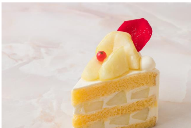
洋梨の果肉をたっぷり使用した贅沢な一品

(あまおうショートケーキ/利平栗のモンブラン/トレゾー) 12月18日(土)までご予約受付中