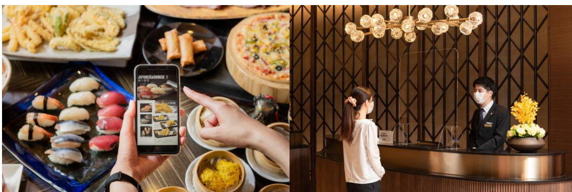
接触・飛沫感染予防に関する対策