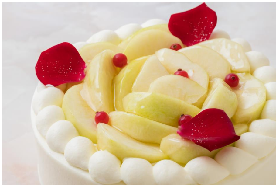
シリーズ第6弾は旬の洋梨をたっぷり使用した「極上洋梨ショートケーキ」

秋から冬にかけてシーズン真っ盛りの洋梨をふんだんに使用し、贅を極めた期間限定の「極上洋梨ショートケーキ」。完熟した上品な味わいと甘い香りが漂う洋梨の美味しさを存分にお楽しみいただきながら、優雅なティータイムをお過ごしください。