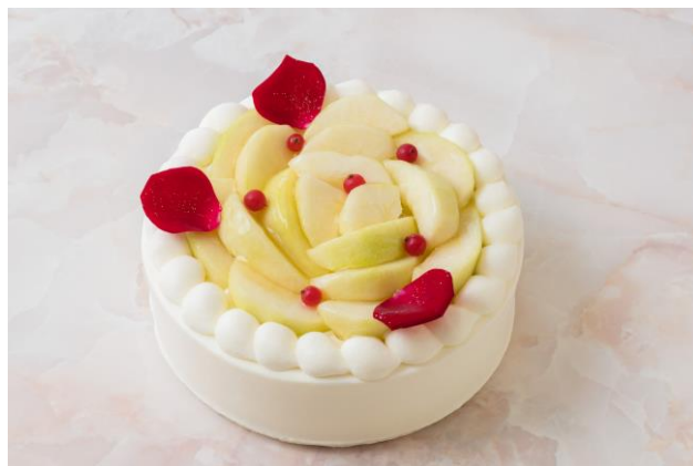
お祝いや贈り物にも最適な極上ショートケーキ