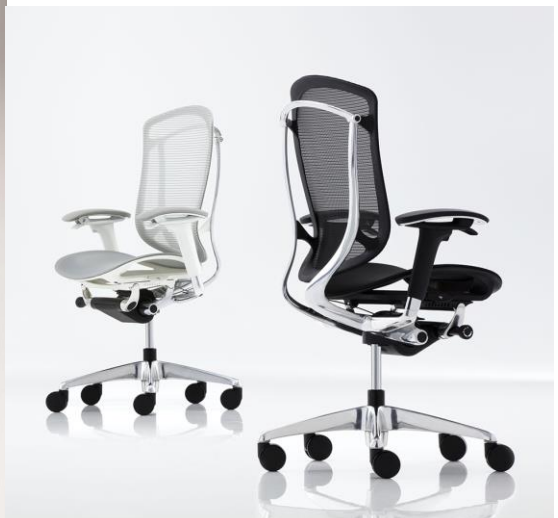
オフィスシーティング「Contessa II」