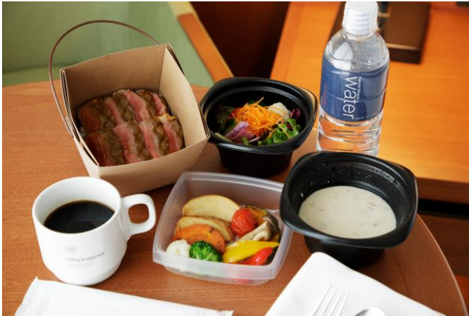
ホテルシェフ特製メニュー（メニュー一例：ステーキ丼+サラダ）