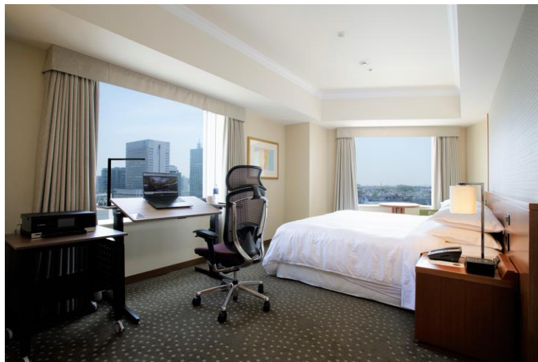
快適性と機能性を体験できる空間 ハイスペック・ワークルーム

横浜駅から徒歩1分、便利な立地にありながら都会の喧騒を全く感じさせない横浜ベイシェラトンと、モノづくりへのこだわりから高品質な製品を提供し続けるオカムラだからこそ実現できた、快適性×機能性から生まれる「ハイスペック・ワークルーム」でワンランク上の都市型ワーケーションをご体験ください。