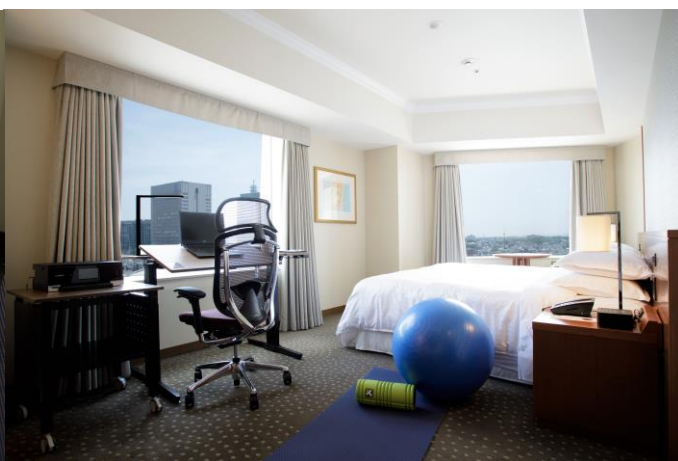
ヨガマットやバランスボールなどストレッチグッズでリフレッシュ