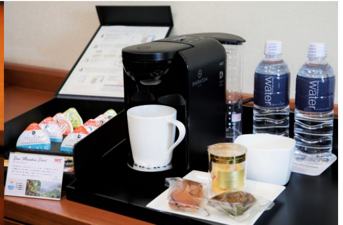
優雅なコーヒーブレイクも魅力