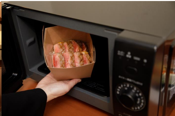
おこもりテレワークに便利な電子レンジやコーヒーマシンも設置