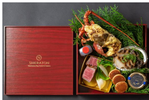
贅を尽くした「さがみ」特製オードブルボックス

■内 容：三重県産 伊勢海老のテルミドール 山口県産 黒鮑の柔らか煮 キャビアとブリニ A5ランクの黒毛和牛フィレ肉のロースト