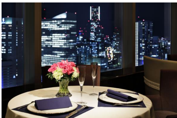
フレンチ「ベイ・ビュー」店内