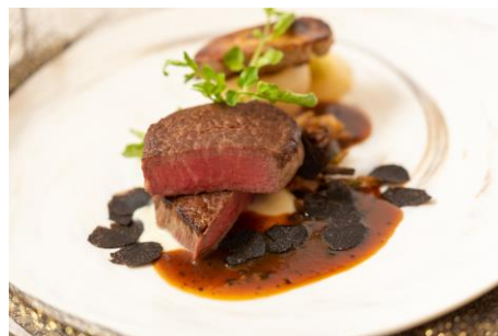
*飛騨牛のフィレ肉とフランス産鴨のフォアグラのロッシェニ 黒トリュフを添えて