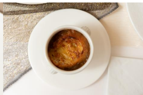
*玉葱をじっくり炒めたオニオンスープ