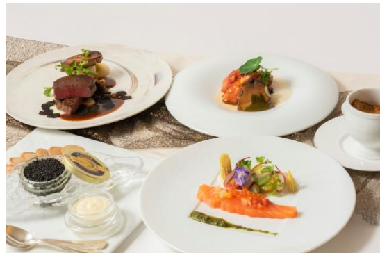
ご自宅でホテルのフルコースを再現