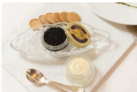
*シベリアアチョウザメのキャビアとブリニ