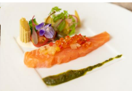
*キングサーモンのマリネ ショーフロウ仕立て 香味野菜とワサビ風味のソース