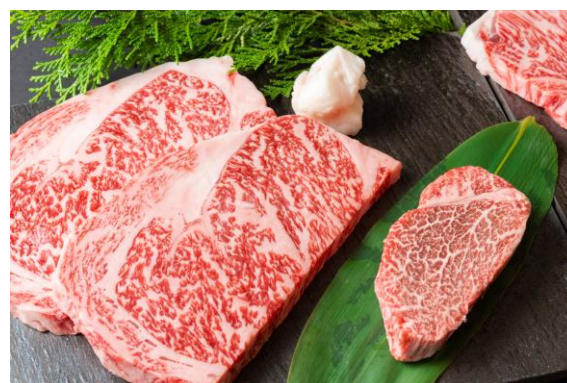
安心の品質保証付き 格別の味わい

■内 容：神戸牛 サーロイン 200g (2枚) フィレ 100g (1枚) 松阪牛サーロイン 200g (2枚) フィレ 100g (1枚)