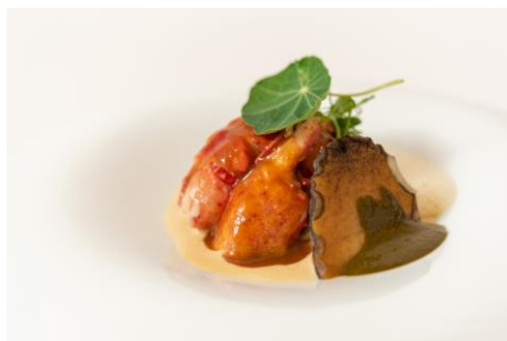
*フランス産オマール・ブルーと国産黒鮑のポワレ ソース クレーム・ド・オマール