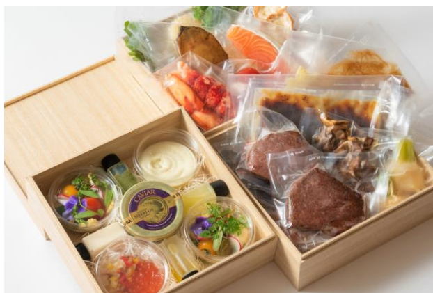
フレンチ「ベイ・ビュー」オリジナルギフトボックス

ご自宅でのパーティーやおもてなしにはもちろん、大切な人へ思いを伝える贈り物にふさわしい横浜ベイシェラトン ホテル&タワーズが自信をもってお届けする【Winter Gift】です。