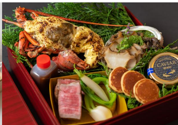
鉄板焼「さがみ」さがみ特製 オードブル BOX