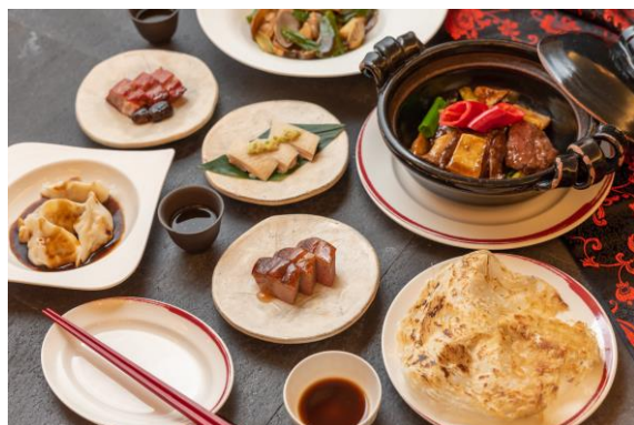
香港ローカルフード ダイパイトン