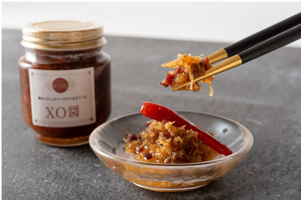
高級食材のうまみがたっぷり 彩龍「XO醬」

おうち時間をワンランクアップする「彩龍」特製「XO醬」は、ご自宅用にはもちろん、贈って喜ばれるお手土産としても最適な一品です。