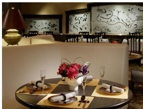
中国料理「彩龍」店内