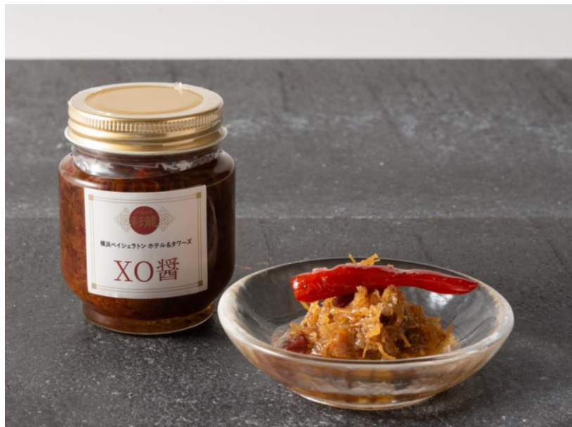
オンラインでも販売スタート