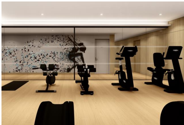
最先端のトレーニングマシンを完備、多様なプログラムを提供

※クロスフィット：走る・起き上がる・拾う・持ち上げる・押す・引く・跳ぶなどの『日常生活で繰り返し行う動作』をベースに、それぞれを万遍なくトレーニングすることで、基礎体力アップとともに、生活動作が楽になるのを実感できるトレーニング。