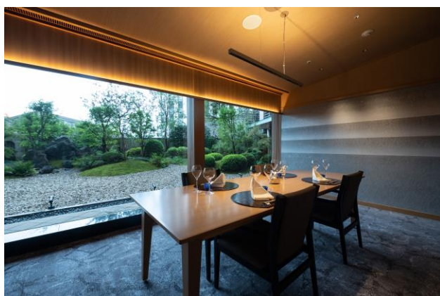
完全個室 日本料理「木の花」