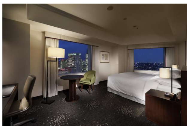
横浜の夜景が美しい客室