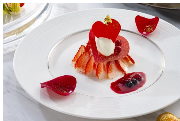
ショコラフレーズ チョコレートと “あまおう”のコンビネーション