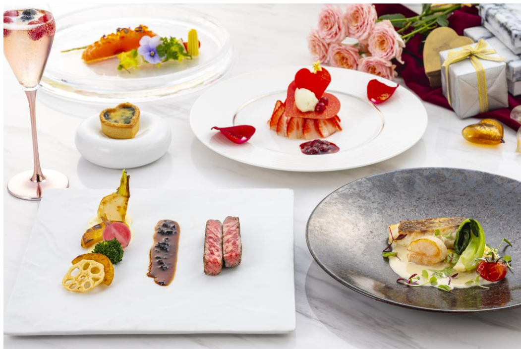
バレンタインのひとときを彩る ストロベリースパークリングカクテルと期間限定のコース

コースの余韻をお楽しみいただくギフトには真っ赤なハートのチョコレートが入った最高級カカオ豆“チュアオ”使用のホテルオリジナルボンボンショコラ「BÉSAME MUCHO（ベサメムーチョ）」をご用意。ご家族や恋人、ご友人など、大切な方と最上階からの美しい横浜の風景と共に、思い出に残るバレンタインのひとときをお過ごしください。