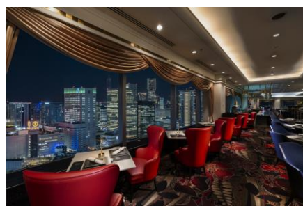
横浜の夜景が美しいフレンチ「ベイ・ビュー」