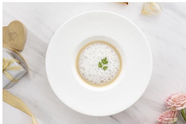
北海道産“北あかり”のクリームスープ ベーコンの泡を添えて