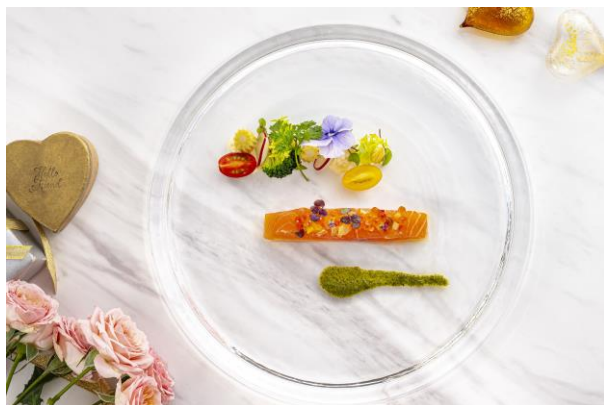
サーモンのマリネ レフォールクリームとワサビ香るバジルソース