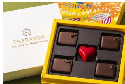
バレンタインボンボンショコラ 「BÉSAME MUCHO (ベサメムーチョ)」