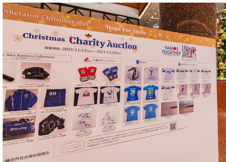
数多くの出品品が出揃うチャリティーオークション(※画像は 2021 年のオークションボード)