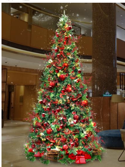
“Jubilation”をテーマにしたクリスマスツリー

又、点灯式当日には、メザニンロビーにて横浜市内の子供たちによるダンスパフォーマンスやクリスマスらしいハンドベルの演奏もお楽しみいただけます。エネルギーに動き出す日常の再開を祝う花火をイメージしたゴールドの装飾や、ご家族やご友人のもとへいぎなう汽車やバスを模ったオーナメントで飾られた高さ約 6m のクリスマスツリーの下は、大切な方々との記念撮影にも最適なスポットです。横浜ベイシェラトンホテルは、世界中から横浜を訪れる人々や未来を担う子供たちの“最高の笑顔”のために、歓喜に満ち溢れるクリスマスタイムをご提案してまいります。