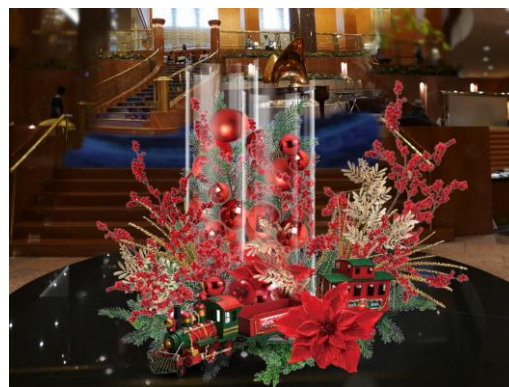
（株）竹中庭園緑化デザインの華やかなクリスマス装飾