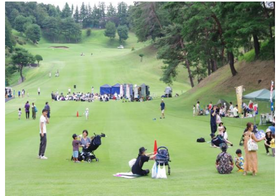
昨年開催時の様子

多くの方にゴルフ場の豊かな自然に触れていただくため、ステージイベントや体験イベント、キッチンカーによる出店などを予定しています。