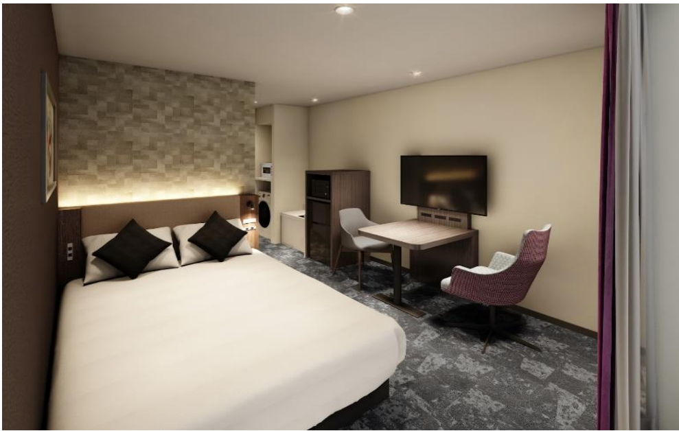
日本橋の石畳をイメージしたカーペットを採用し「わびさび」を表現した客室パース画像（レジデンシャルダブル）

また、来春にはロビーエリアもリニューアルし、「光と色彩が織り成す交差点」をコンセプトとした新たな空間として生まれ変わる予定です。