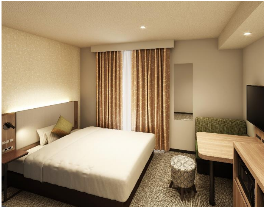
漆喰をイメージしたクロスを採用した客室パース画像（スタンダードダブル）