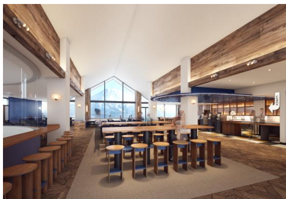
レストラン「sanshoku」店舗イメージ