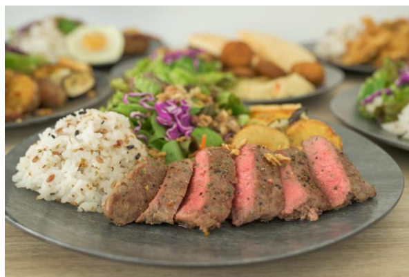
レストラン「sanshoku」料理イメージ