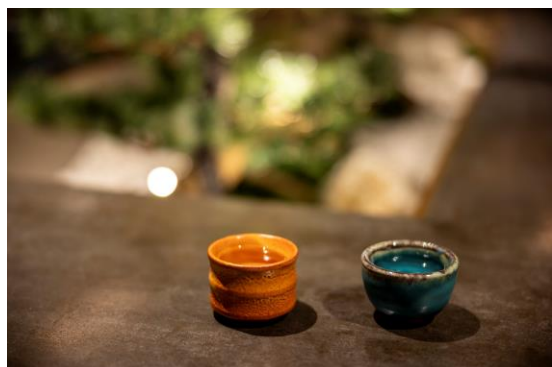
お好みのおちょこで味わう至福の一杯