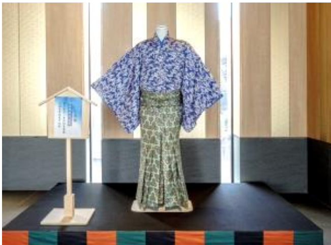
『番町皿屋敷』青山播磨役の衣装 (時期により展示内容を変更しています)

また館内では、季節ごとに歌舞伎俳優の着用する舞台衣裳を展示し、歌舞伎関連グッズの販売や、南座の番附(プログラム)をご覧いただけるなど、歴史ある地の伝統を大切にしています。荘厳なアートは、ゆかりの深い歌舞伎文化への敬意を表すとともに、訪れるお客様を格調高い雰囲気でお迎えいたします。