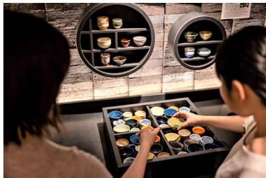
多彩なデザインのおちょこをご用意