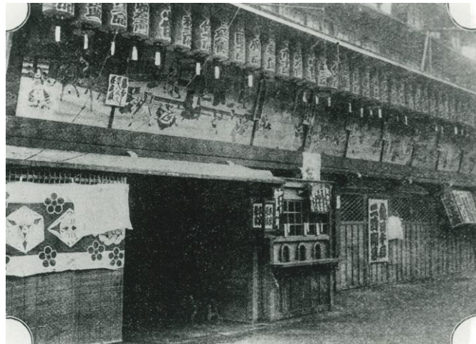
1900年頃の京極歌舞伎座の外観