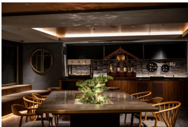
2024年10月リニューアル 「東急ステイ京都三条烏丸-はなれ-」 宿泊者専用ラウンジ「らうんじはなれ」

「東急ステイ京都三条烏丸-はなれ-」宿泊者専用ラウンジ 日本酒や駄菓子が楽しめる新サービス開始