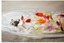
帆立 根セロリ こぶみかん