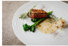
京鴨 菊芋 コーヒー