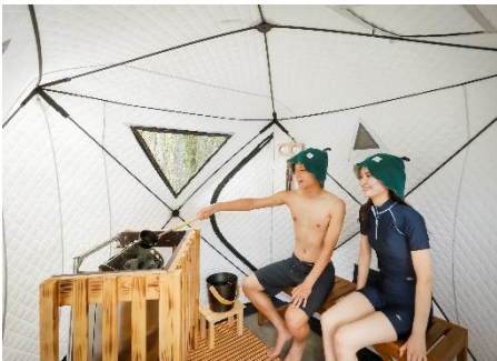
プールサイドサウナ

寒い冬に縮こまった身体を芯から温め、滞った身体のめぐりを整える冬季限定のウェルネスパッケージとして、雄大な自然の中でのサウナ体験とスパトリートメントを組み合わせた「THE ROKU SPA サウナ&トリートメントプラン」を販売いたします。北山杉や京都ヒノキ、レモングラスをブレンドしたホテルオリジナルアロマオイルによるセルフアロマなど、ROKU KYOTO ならではのサウナ体験を90分間たっぷりと満喫いただいた後、熟練のセラピストによるボディまたはフェイシャルトリートメントを60分間ご体験いただけます。サウナのご利用とスパトリートメントとを組み合わせることで、より高いリラックス効果が期待でき、手足の冷えを解消しつつ日常の疲れを全身から解き放っていただけます。京都の奥座敷でととのうサウナ体験と、癒しと寛ぎの空間で行うスパトリートメント、2つの人気メニューを同時に体験できる至福のウェルネスエクスペリエンスをお楽しみください。