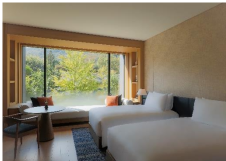
デラックスルーム

ホテルの魅力を余すことなく満喫する本プランでは、レストラン「TENJIN」でのご朝食やご夕食、「THE ROKU SPA」でのスパトリートメント、自然の中でのウェルネスアクティビティ、唐紙摺り体験やパステルスケッチ体験といったホテルオリジナルのワークショップが含まれ、ホテルに到着してからは予算を気にすることなく、ROKU KYOTO の魅力をもれなく体験していただけます。鷹峯三山の麓の美しい自然に包まれたリゾートエリアで、都会の喧騒から離れ、非日常を味わう上質な時間をご体験ください。