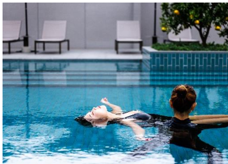
フローティングメディテーション