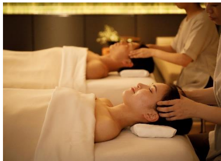
スパトリートメント イメージ