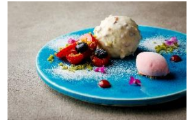
ピスタチオ ラズベリー ショコラブラン