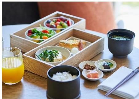
インルームダイニング朝食